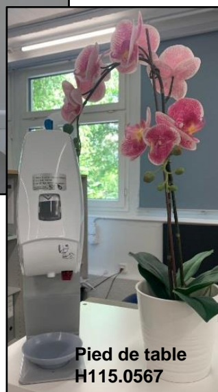
Pied de table H115.0567